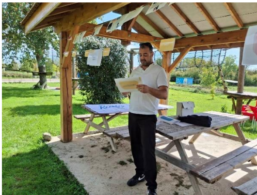
Intervention pour la PJJ (ci-dessus) et animation sur l'écologie décoloniale (à droite)