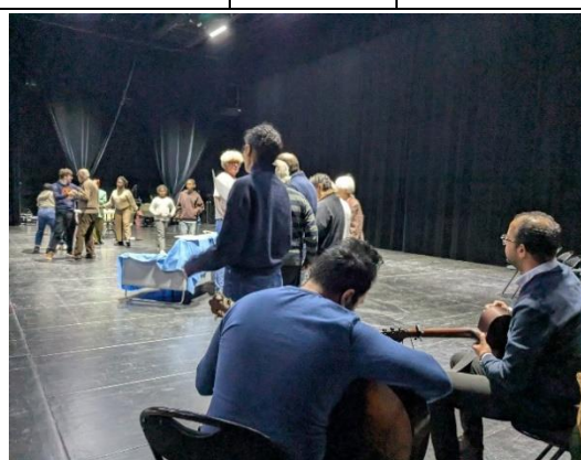
Représentation de la Plantuffe