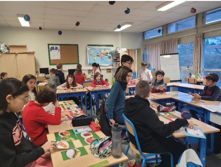
Animation au Collège de Pesmes, Ecole T. Bernard Besançon et aux jeunes de Pari (gauche, de haut en bas) Jeu de la laïcité (en haut) et Wasta (en bas).