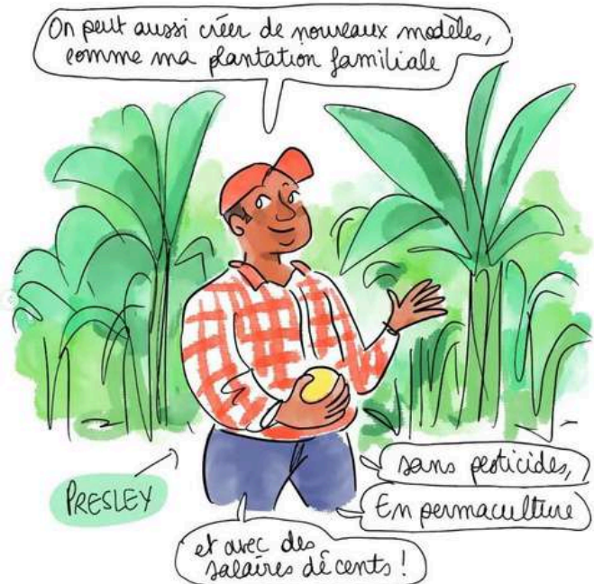
Illustration : Blanche Sabbah

Dans le monde, de nombreuses communautés sont victimes d'accaparements de terres. Leurs terres sont envahies par de grandes entreprises, parfois sous les menaces et la violence. Privées de ressources, elles doivent alors émigrer, ou travailler pour ces entreprises.