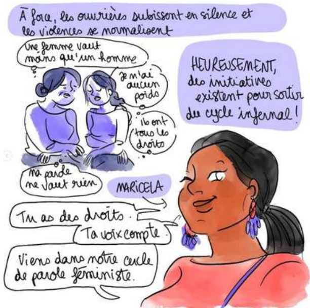
Illustration : Blanche Sabbah

Pour une femme, travailler et vivre dignement de son travail reste partout dans le monde plus dur que pour un homme. Et le secteur agricole ne fait pas exception, loin de là. Pour aider les ouvrières à se défendre, notre partenaire équatorien ASTAC a créé un espace d'information et d'entraide dédié.