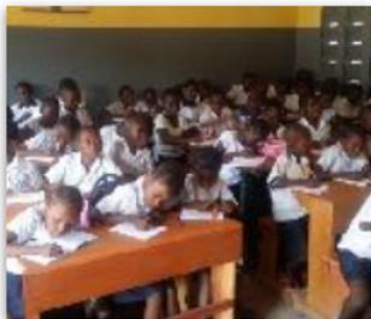
Enfants scolarisés au centre de rattrape scolaire de Kinshasa en RDC

Tous les dons recueillis sont intégralement reversés aux partenaires porteurs des projets sur place.