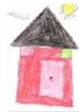
Dessin réalisé par un enfant scolarisé à l'école de PCJ - Cité du Soleil - Haïti

Si vous êtes imposable, un don de 20 euros vous revient réellement à 6,80 euros car il vous permet de déduire 13,20 euros