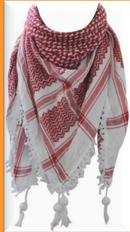
Keffieh Rouge et blanc, plutôt le keffieh arboré par les partis de la gauche palestinienne (en cours de réapprovisionnement)