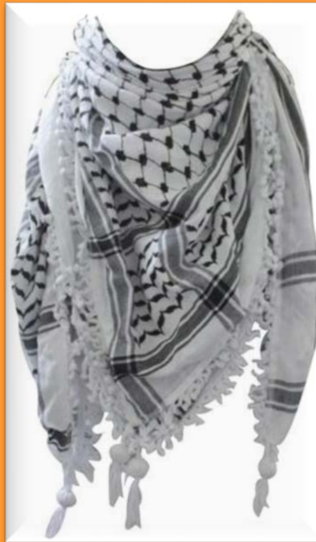
Keffieh Noir et blanc, le plus célèbre, associé à Arafat (en cours de réapprovisionnement)

Puissant symbole du peuple palestinien, de sa culture et de sa résistance, ces keffieh viennent d'Hébron où les colonies d'occupation sont installées au cœur même de la vieille ville palestinienne. Du fait de cette occupation et du harcèlement permanent des colons contre la population palestinienne, l'économie est sinistrée et les Palestiniens sont chassés de leurs maisons. C'est pourquoi, nous soutenons la dernière fabrique de keffieh de Palestine, installée à Hébron, pour que les Palestiniens puissent rester et vivre sur leur terre.